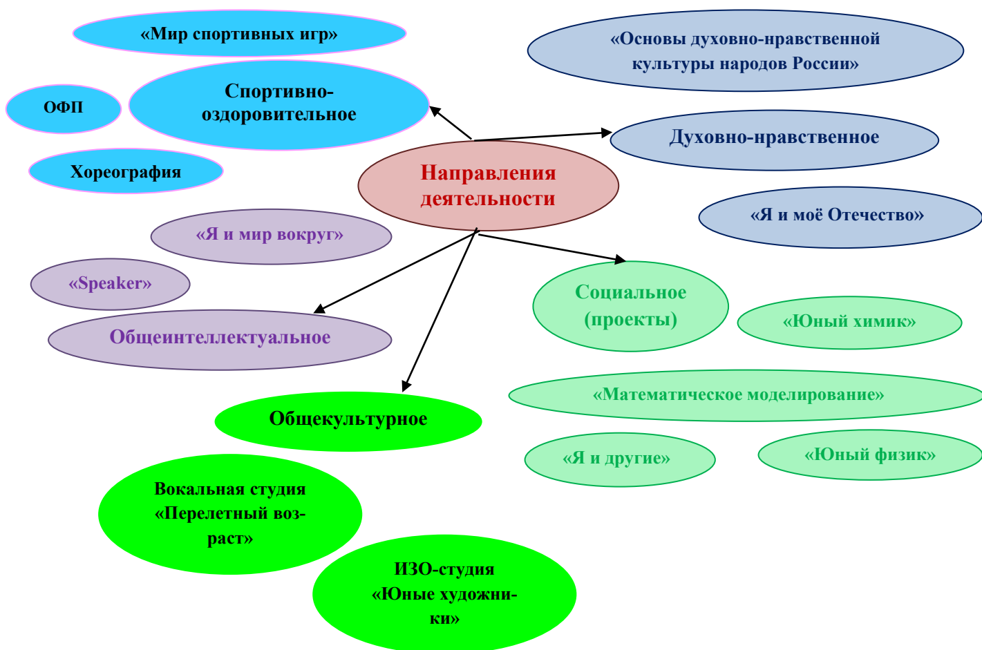
Система дополнительного образования

Виды внеклассной работы. Система внеурочной деятельности.